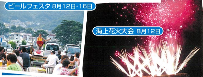
ビールフェスタ 8月12日・16日