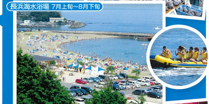
長浜海水浴場 7月上旬~8月下旬