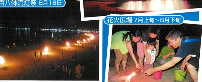
百八体流灯祭 8月16日