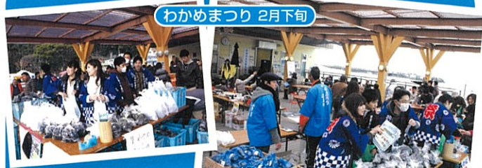
わかめまつり 2月下旬

●関西方面より... 沼津インターから、伊豆縦貫道經由、 熱函道路-熱海を経て約1時間