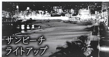
サンビーチ ライトアップ

古くから來宮大明神と称し、来福・縁起の神様として信仰され「延喜式神名帳」には「阿豆佐別神社」の名で記されています。御神木「大楠」と境内に約160個のLEDを鳥かごや浮き球に仕込み、境内全体「木霊」を表現したライトアップも行っています。